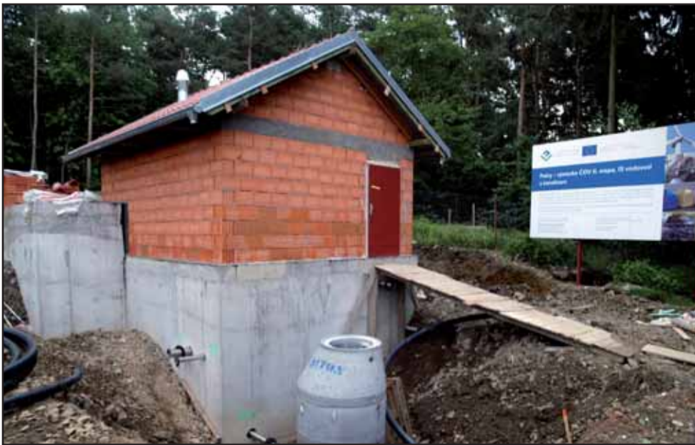
Výstavba nového vodojemu Vysoká v Dolních Jirčanech