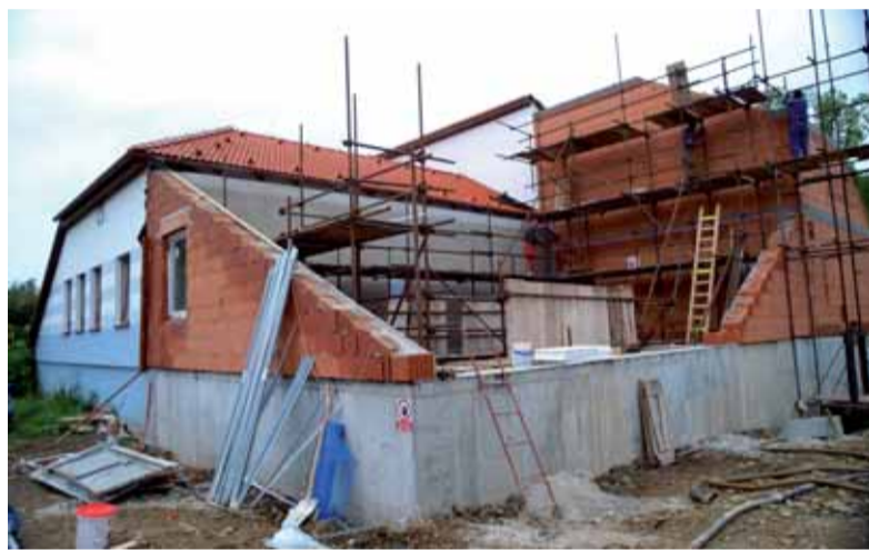
Kapacita čistírny odpadních vod po rekonstrukci stoupne na 6 000 obyvatel.