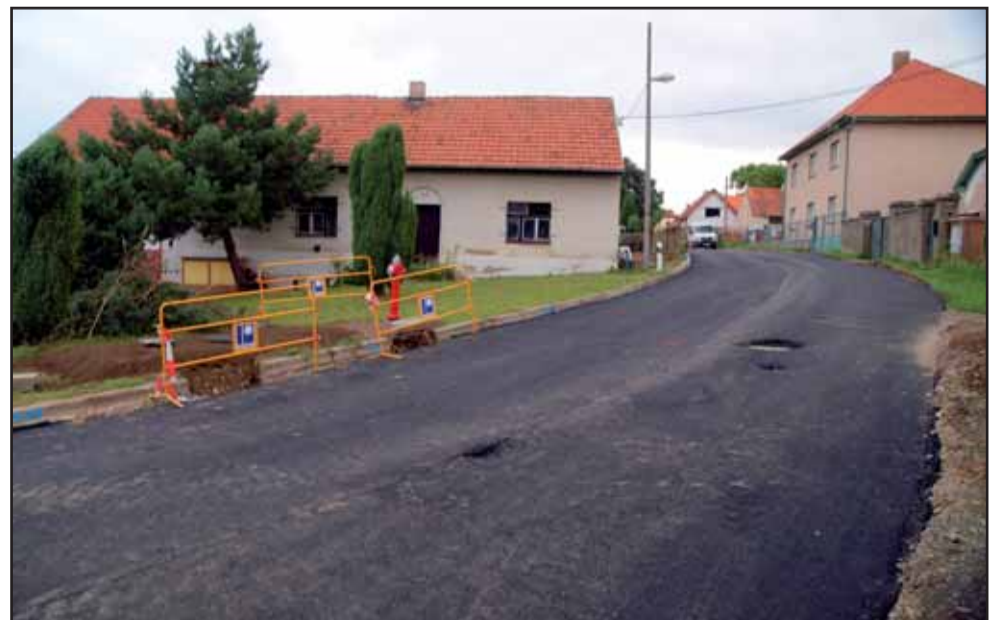
Výstavba kanalizace a rekonstrukce ulice Hlavní u hasičské zbrojnice v Dolních Jirčanech