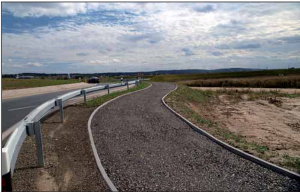
Cyklotezka budovaná podél přeložky silnice Jesenice-Dolní Jirčany byla jednou z podmínek souhlasu obce Psáry