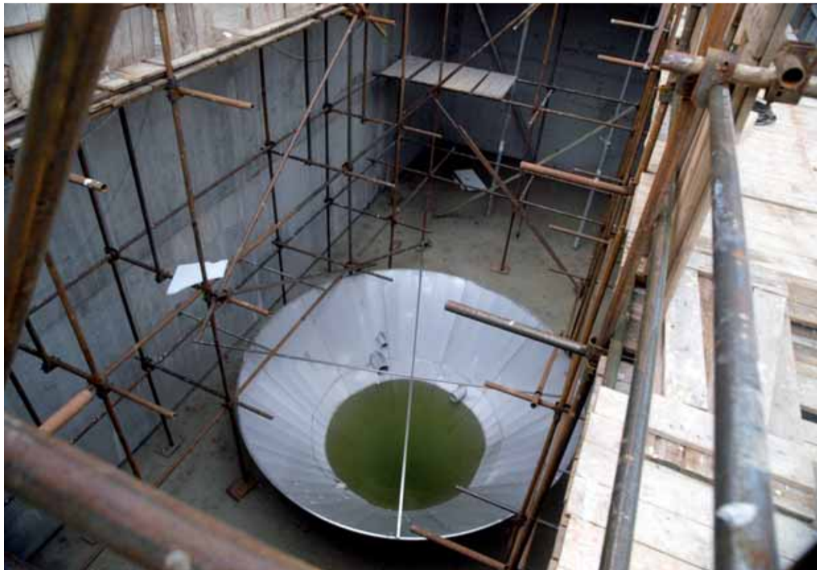
Technologické zařízení v rozšiřované ČOV Psáry

Žádost o dotaci na kanalizaci, vodojem Vysoká i rekonstrukci ČOV byla obcí podána v květnu 2009, tedy v termínu.