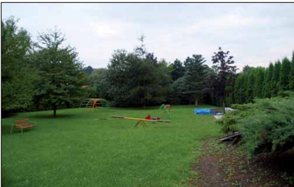
Zahrada mateřské školy na Štědříku