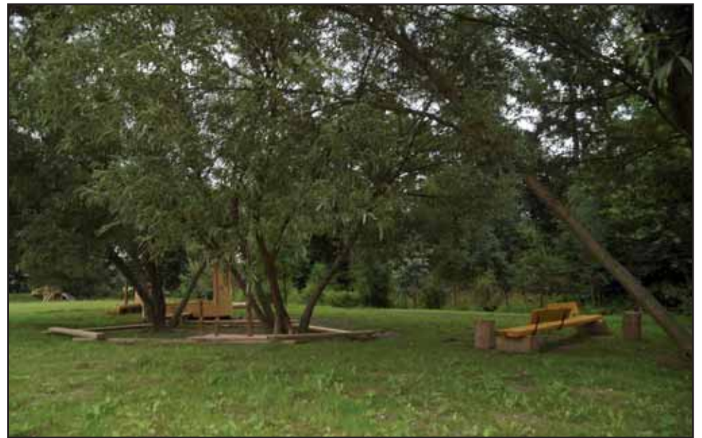
Místo na posezení v budovaném parku na Štědříku