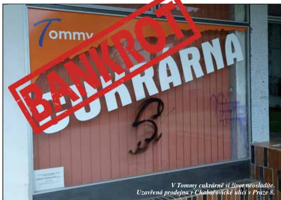
V Tommy cukrárně si život neosládlíte. Uzavřená prodejna v Chabařovické ulici v Praze 8.