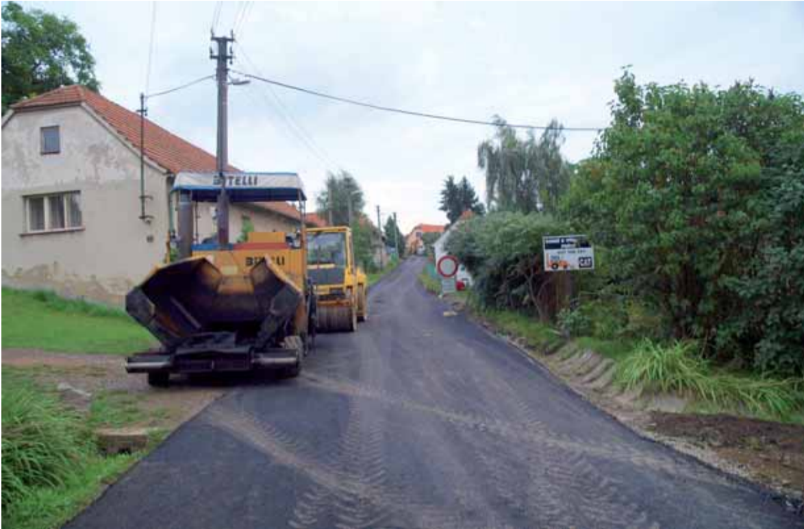
Výstavba inženýrských sítí a rekonstrukce komunikace Hlavní v Dolních Jirčanech.