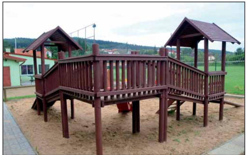
Dětská prolézačka na fotbalovém hřišti v Psárech