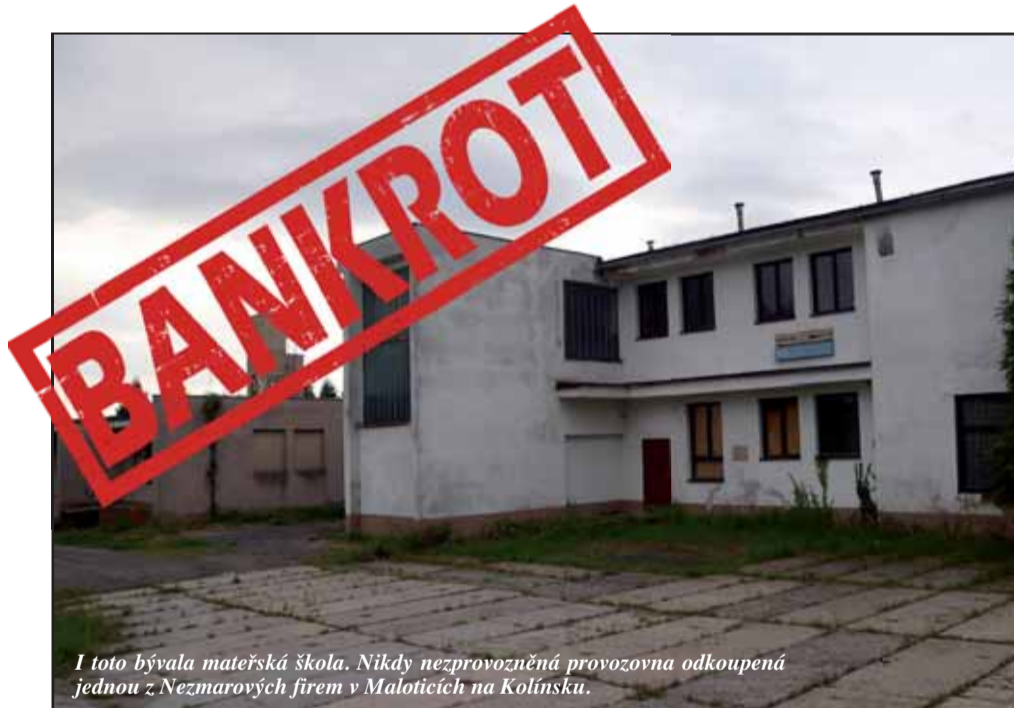
I toto bývala mateřská škola. Nikdy nezprovozněná provozovna odkoupená jednou z Nezmarových firem v Maloticích na Kolínsku.