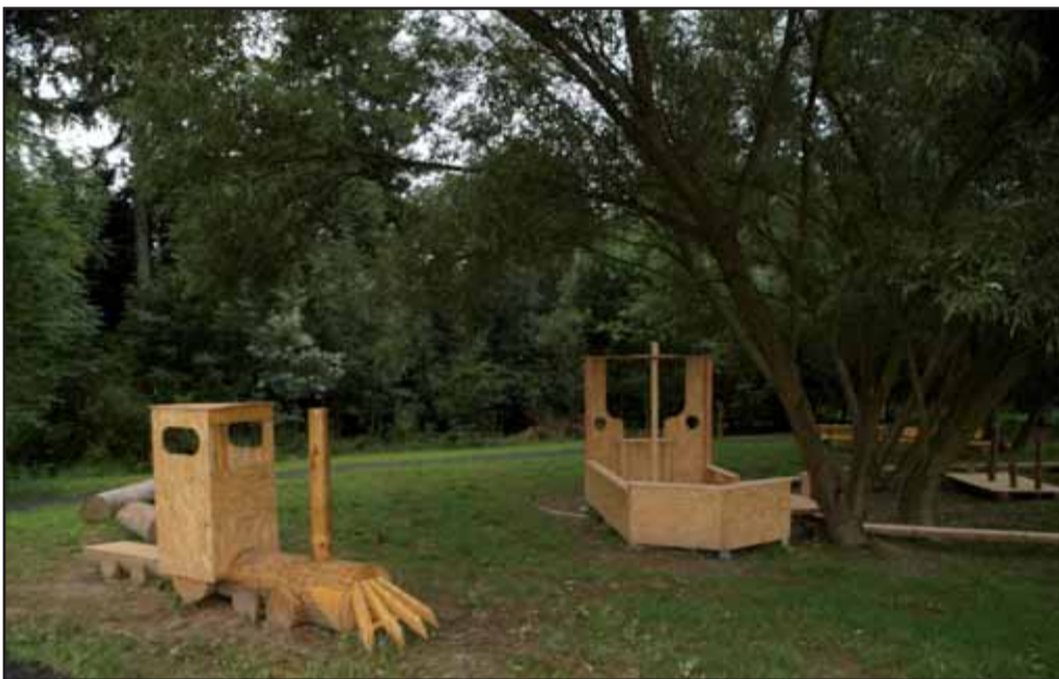
Dětské prolézačky tamtéž