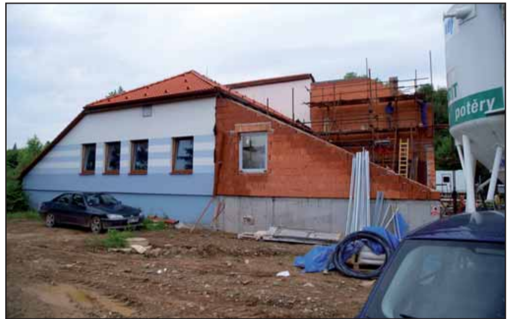
Rozšiřovaná ČOV na Záhořanském potoce pod Psáry