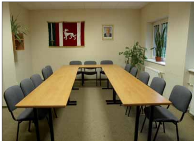
Kdo zasedne v této místnosti po volbách?